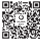
奥佳华官方微信二维码